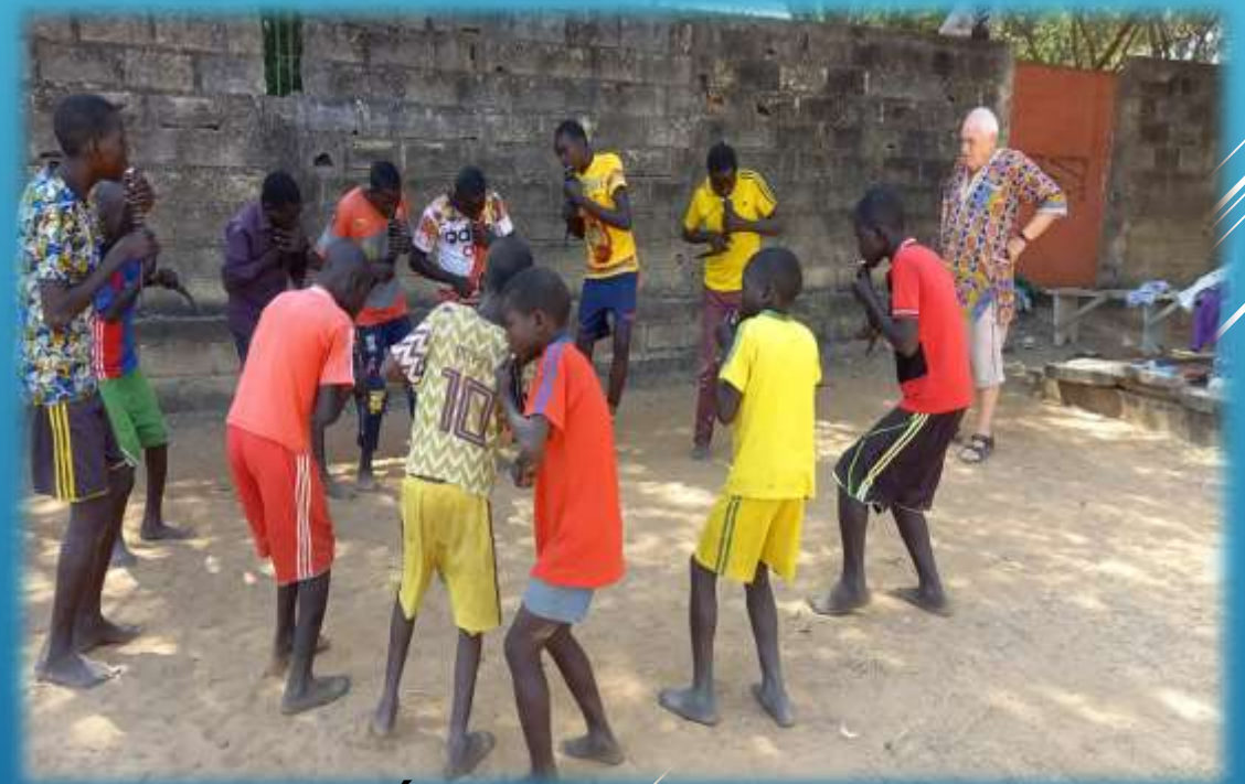
DANSA TÍPICO MASSA (GRURUNA)