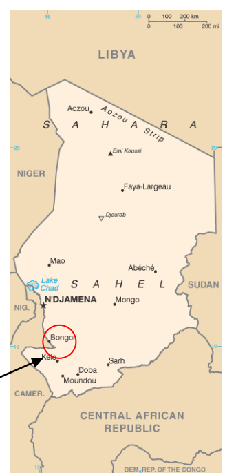
Mapas de de Camerún y Chad, y localización del Valle del Logone: Zona de intervención del proyecto.

● El Valle del Logone (El río Logone delimita la frontera entre Chad (Departamento de Mayo-Kebbi) y Camerún (Departamento de Mayo-Danay) en esta región.